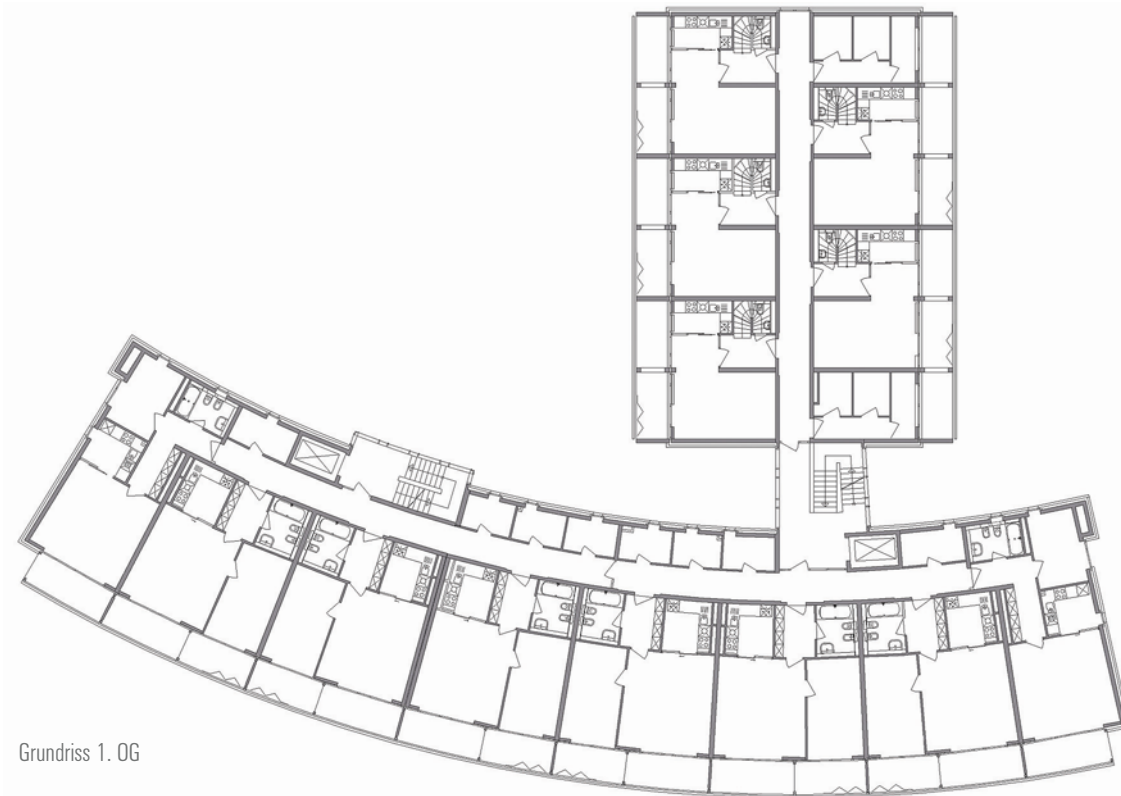
Grundriss 1. OG